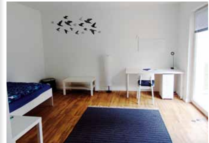
Einzelappartement in der Jugendwohnung

In den großzügigen Wohn- und Essbereichen finden die gemeinsamen Aktivitäten und Gruppentreffen statt.