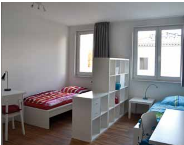
Beispiel: Doppelzimmer in der Wohngruppe