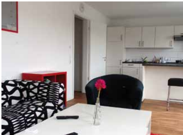
Beispiel: gemeinsamer Wohnbereich in der Jugendwohnung