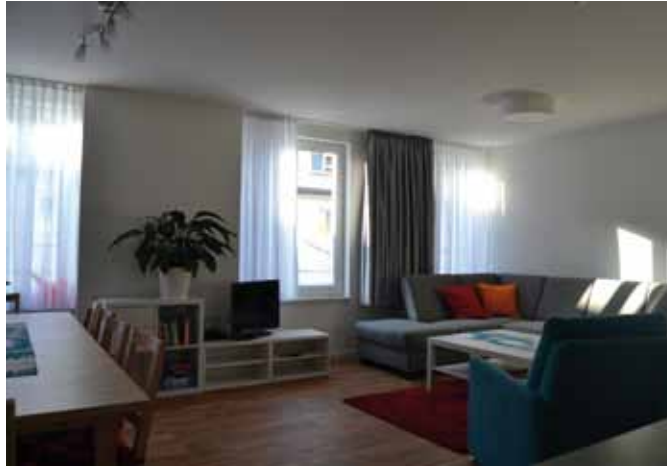
Gemeinschaftsraum in der Wohngruppe

Die vollstationäre Wohngruppe bietet 9 Plätze für Jungen und Mädchen ab 10 Jahren. Die Betreuung erfolgt über Tag und Nacht „rund-um-die-Uhr“.